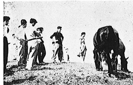
青森県八戸、種差海岸の牧場で