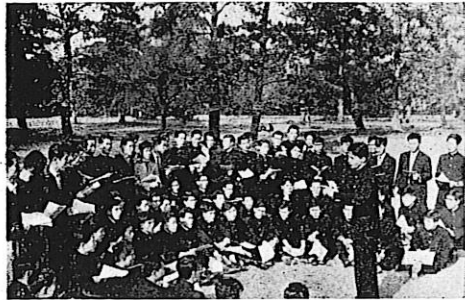
御所に於る練習風景