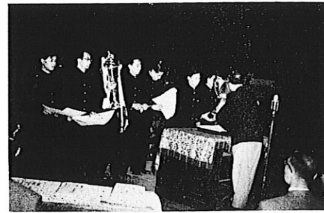
夢に遙見た全国優勝!