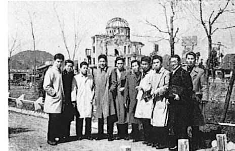
原爆ドームをバックに広島にて