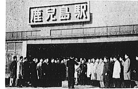
鹿児島駅頭でカレッジソング