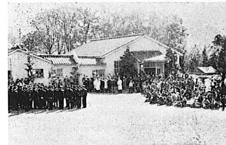
長崎河で結核療養所慰問