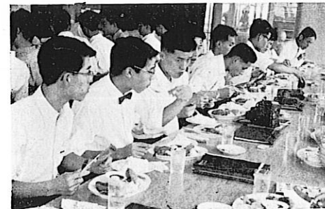
ステージ前の腹ごしらえ